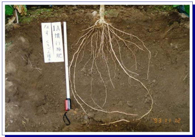
岩手県園芸試験場南部分場 (1993年)